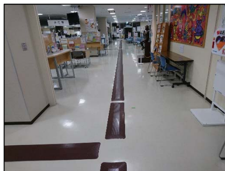
写真② 2階フロア全面

平成30年3月25日に石巻市役所（宮城県石巻市穀町）において、視覚障がい者歩行誘導ソフトマット「歩導くん ガイドウェイ」が採用されました。市役所改修に向けた障害者差別解消法対応の一環として導入されました。