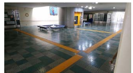
長居障がい者スポーツセンター