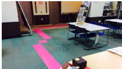
日本ライトハウス