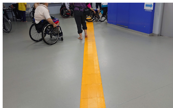
(写真: 誘導マットの上を通過する選手たち)