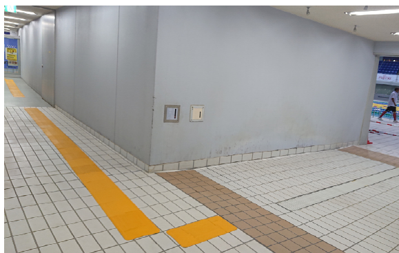
(写真: 選手待機場からプールサイド入口までの設置)

http://www.kinjogomu.jp/welfare/paraspo.html