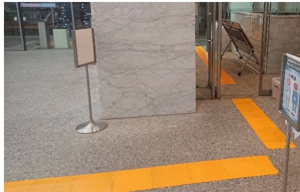
写真右：チャリティ会場内の誘導